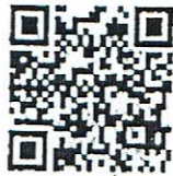
QR Code สำหรับลงทะเบียน

ขั้นตอนที่ 3 เมื่อท่านลงทะเบียนแสดงความประสงค์เข้าร่วมสัมมนาสำเร็จแล้ว ระบบจะส่งข้อความยืนยันการลงทะเบียน, ลิงค์เพื่อเข้าร่วมสัมมนา, Meeting ID และ Passcode สำหรับ Log in เพื่อเข้าร่วมสัมมนาออนไลน์โดยระบบ Zoom ทางช่องทาง ดังนี้