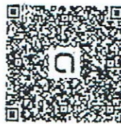
QR Code LINE Open Chat สัมมนา